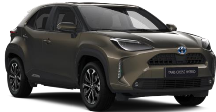
6X1 Oxide Bronze Metallic