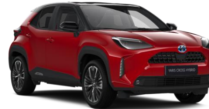
2SZ Emotional Red Metallic / Black

Erfahrungsgemäß können Druckfarben den Farbton von Lackierungen nicht originalgetreu wiedergeben. Abb. MY22