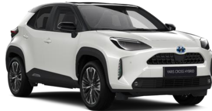
2PU Platinum Pearlwhite Metallic / Black