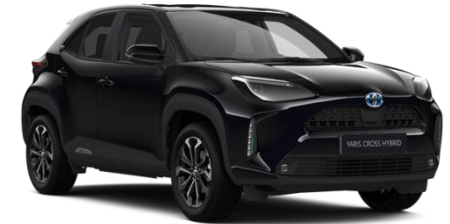
209 Night Sky Black Metallic