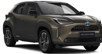
2TK Oxide Bronze Metallic / Black