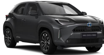
1G3 Ash Grey Metallic