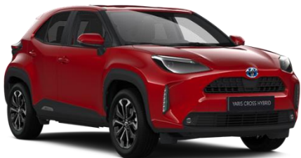
3U5 Emotional Red Metallic