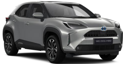
1L0 Shimmering Silver